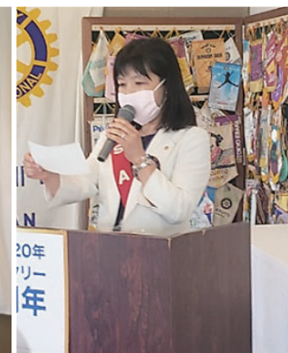
水庫 SAA ニコニコボックス発表