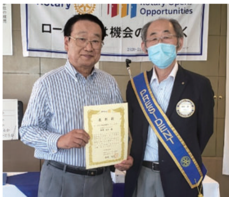
藤井会員米山功労者表彰